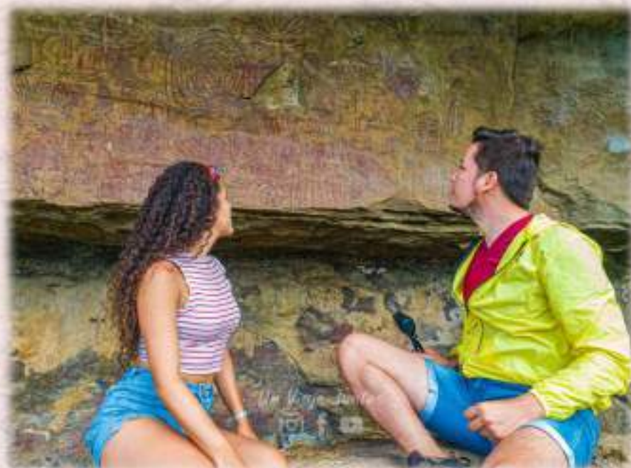
Tercer Panel con pictografías en el sendero

"Tocaregua": lugar desde donde se controla el río