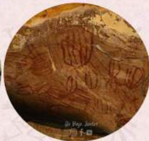
Huellas de afilado de herramientas y pictografías de "barbacoas", antigua técnica de pesca que usaban los indígenas