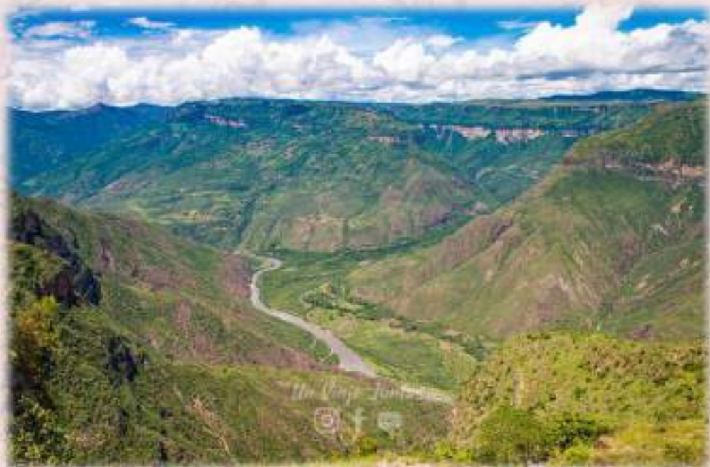
Mirador al Cañón del Chicamocha desde el sitio con pictografías